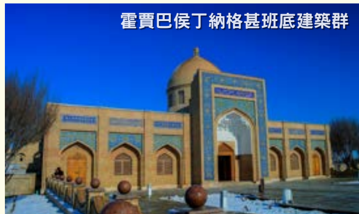
霍賈巴侯丁納格甚班底建築群