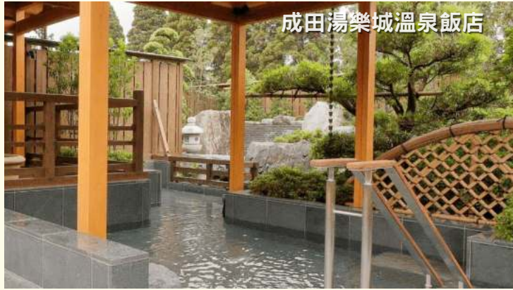
成田湯樂城溫泉飯店

東京 &gt; 大宮鐵道博物館 &gt; 小江戸川越【穿越回到江戸時代】 &gt; 寶川溫泉汪泉閣【天下第一大露天混浴溫泉】