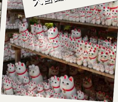
招財貓神社豪德寺